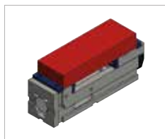
Campo de amarre O3