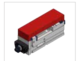
Campo de amarre O5