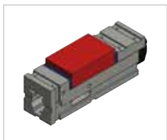
Campo de amarre O1