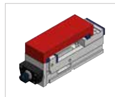
Campo de amarre O4