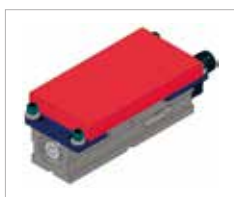
Campo de amarre O2