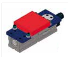
Campo de amarre O1